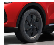
Essential Oceľové disky 16" s aerodynamickými krytmi (215/60 R16)