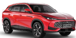
● Diamond Red Metalická farba