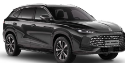
● Pebble Black Metalická farba

*Metalické a trojvrstvové farby sú za príplatok vo výške 600 EUR s DPH