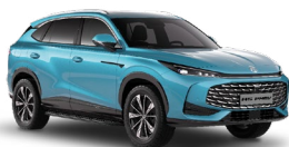
● Arctic Blue Základná farba