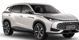
● Sterling Silver Metalická farba