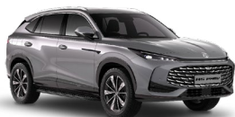
● Hampstead Grey Metalická farba