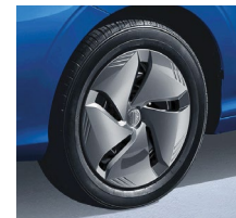
Essential 15" oceleové disky + pneumatiky 185/65R15