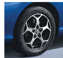
Emotion 16" zliatinové disky + pneumatiky 195/65R16

*Metalické a trojvrstvé farby sú za príplatok vo výške 600 EUR s DPH